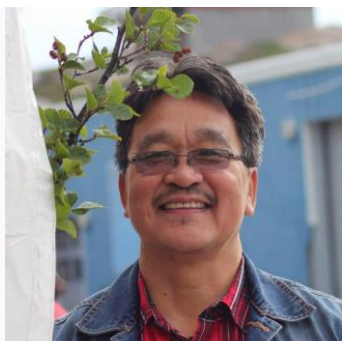
Oplægsholder, initiativtager af mandegrupper, Grønland