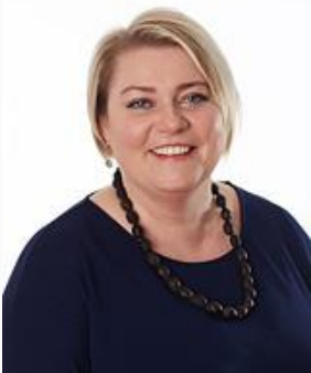
Oplægsholder, Lagtingsmedlem, Færøerne