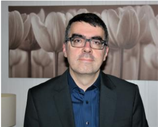
Oplægsholder, lektor i Antropologi, Færøerne