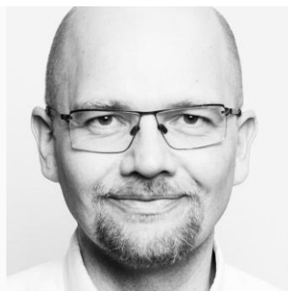
Oplægsholder, Formand for Ligestillingsnævnet, Færøerne