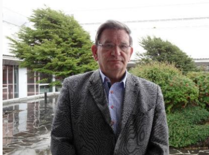
Oplægsholder, Speciallæge i samfundsmedicin