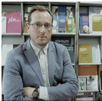
Oplægsholder, Sociolog og ekspert i ligestilling, Island