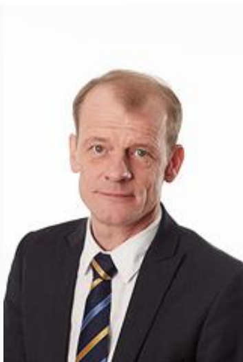
Oplægsholder, Medlem af Løgtinget, Færøerne