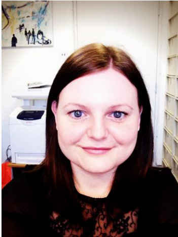
Oplægsholder, Kandidat i Politik og Forvaltning, Færøerne