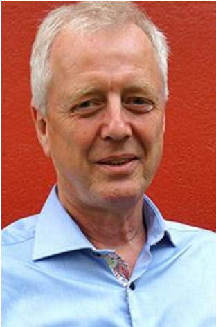
Oplægsholder, Direktør ved Polar Law, Island