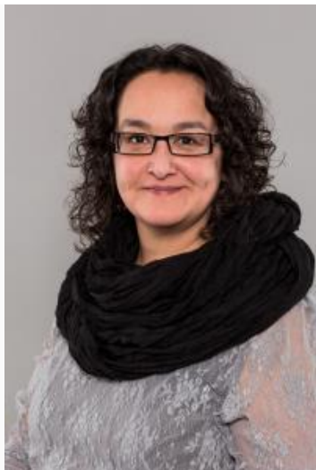
Oplægsholder, Formandssekretær, Grønland