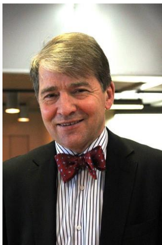
Oplægsholder, Direktør i Arktisk Råd sekretariat, Norge