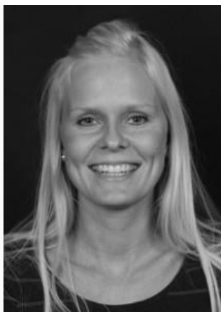
Oplægsholder, International rådgiver, Island