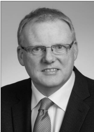
Oplægsholder, Senior Arctic Official, Island