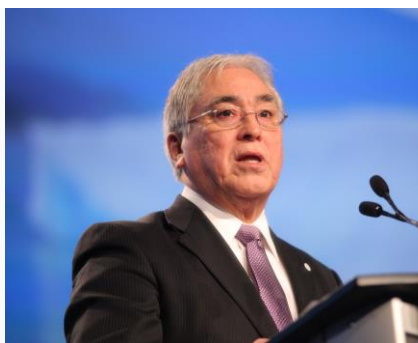
Oplægsholder, Bestyrelsesmedlem af ICC- Grønland