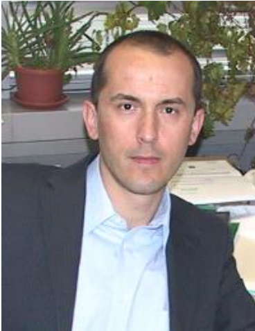
Oplægsholder, Professor i internationale relationer, Slovenien