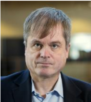
Oplægsholder, Professor i Historie, Island