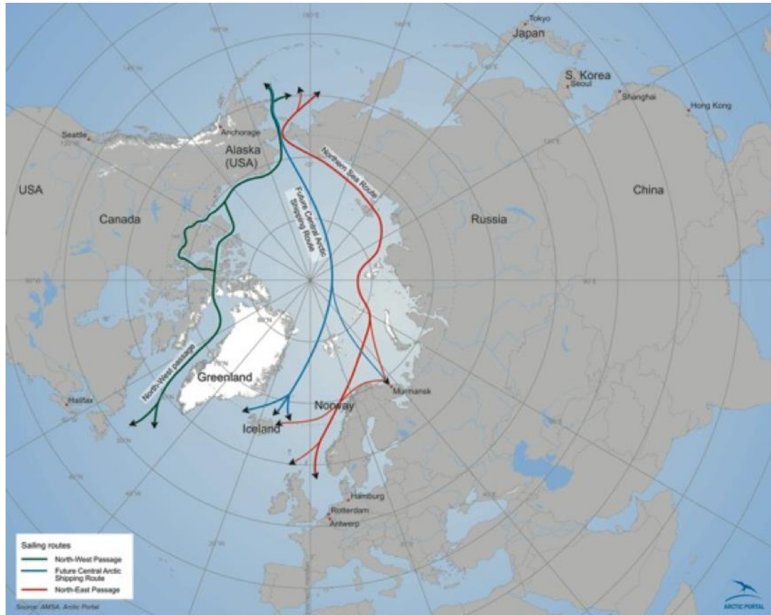
Arktiske skibsruter 47

når de store rederier ser en gevinst i at forbinde deres internationale netværk, så vil en øget strøm gennem Arktis kunne vise fordele for verdens vigtigste handelsruter mellem Asien og Nordamerika / Nord Europa (der tegner sig for 60 procent af transkontinentale TEU godsmængder 46 ).