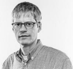
Oplægsholder, Direktør, NORA, Færøerne