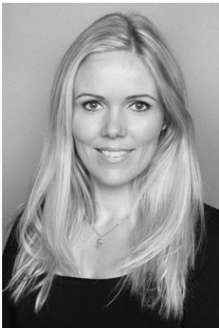
Oplægsholder, Direktør Arctic Circle Secretariat, Island