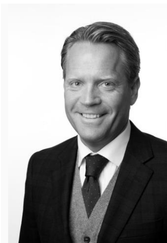
Oplægsholder, Økonom, Island