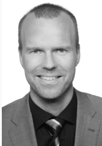
Oplægsholder, Direktør i Air Iceland