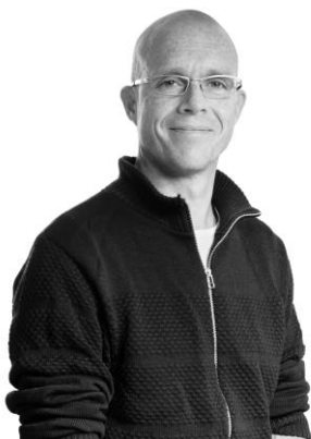
Oplægsholder, Lektor, Syddansk Universitet, Danmark