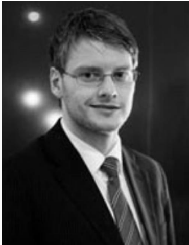
Oplægsholder, Sekretariatschef, Kinas Polarforskningsinstitut, Kina