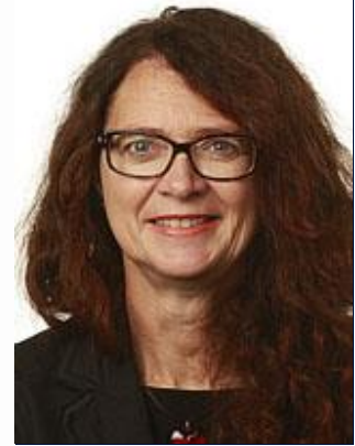
Medlem af Stortinget, Norge