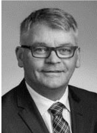
Medlem af Altinget, Island