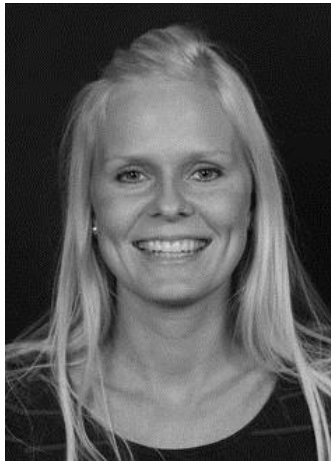
Delegationssekretær, Islands delegation