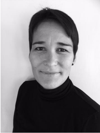
Generalsekretær, Vestnordisk Råd, Island