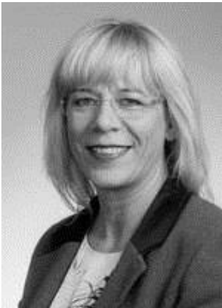
Medlem af Altinget, Næstfmd. Delegationen, Island