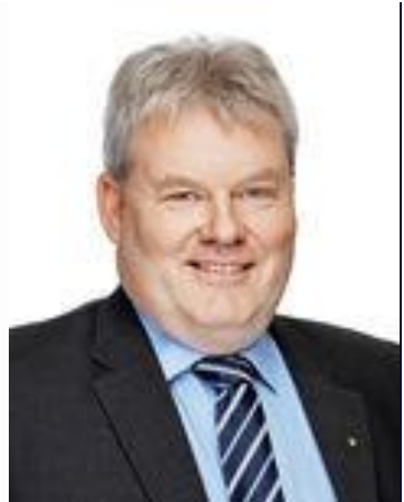
Fiskeri- og Landbrugsminister, Island