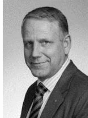
Medlem af Altinget, Island