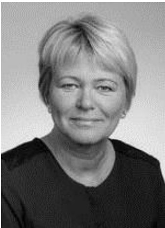
Medlem af Altinget, Island