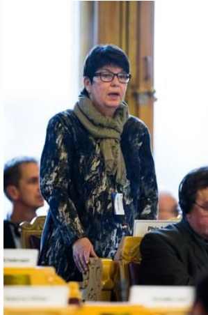
Medlem af NR præsidium, Sverige