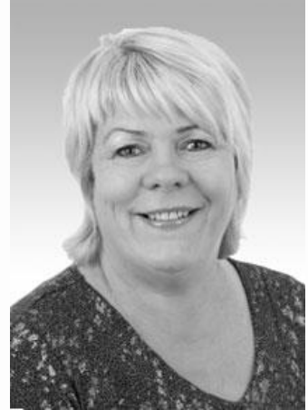
Medlem af Altinget, Island