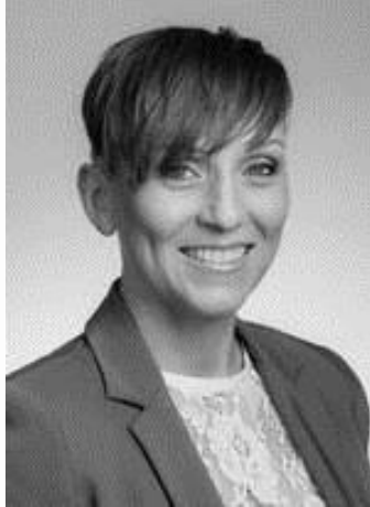
VNR, Anden viceformand og medlem af Altinget, Island